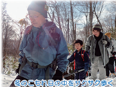
冬のコもれ目の中をサクサク歩く

例年より遅い雪が網張の森を冬の姿に変えた。スタッフも参加者も毎年、この季節を楽しみ待っている。一年ぶりの雪の感触はみんなをワクワクさせた。参加者総勢 24 名