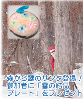
森から謎のサンタ登場！参加者に「雪の結晶プレート」をプレゼント

例年より遅い雪が網張の森を冬の姿に変えた。スタッフも参加者も毎年、この季節を楽しみ待っている。一年ぶりの雪の感触はみんなをワクワクさせた。参加者総勢 24 名