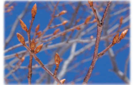
網張の膨らんだブナの冬芽、豊作の期待！

よく観察すると冬芽の形には違いがありその内容は次の①から⑤までのタイプに分けられる。①（葉だけを内包）②（雄花と葉を内包）③（雌花と葉を内包）④（雄花と雌花と葉を内包）⑤（雄花のみ内包）。この中で特に④の雄花と雌花と葉を内包したものが最も太く、次に太いのは②（雄花と葉）及び⑤（雄花のみ）で雄花の房（花序）がブナの冬芽を太くすると思われる。