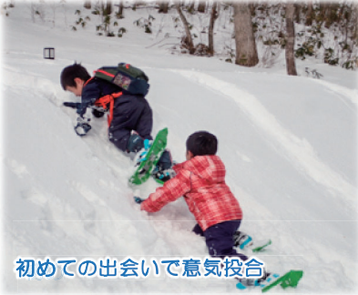
初めての出会いで意気投合