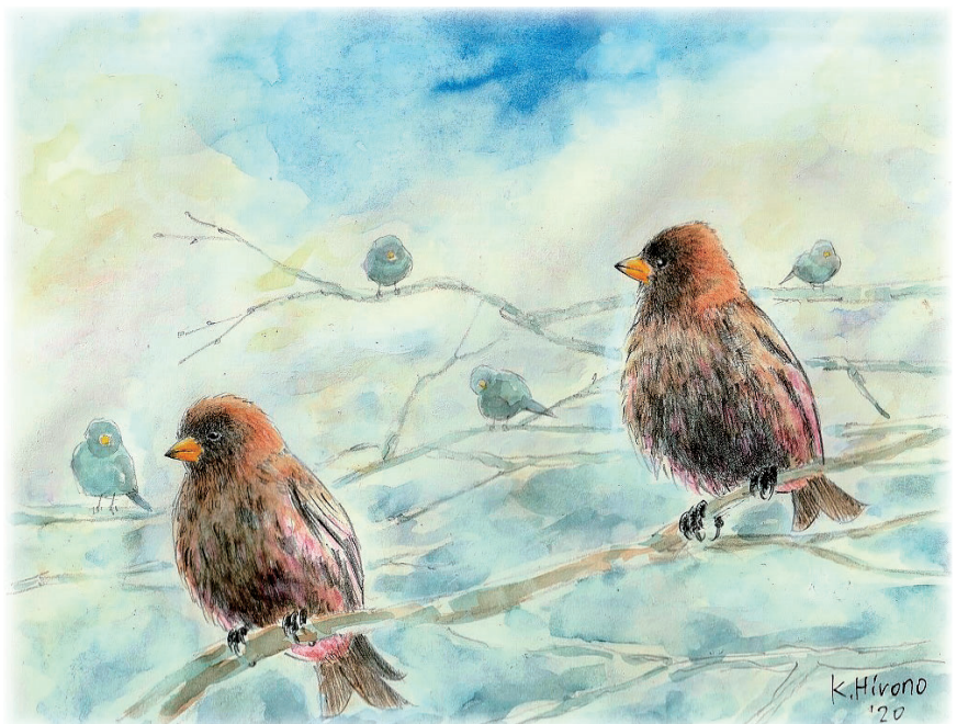
K. Hirano '20