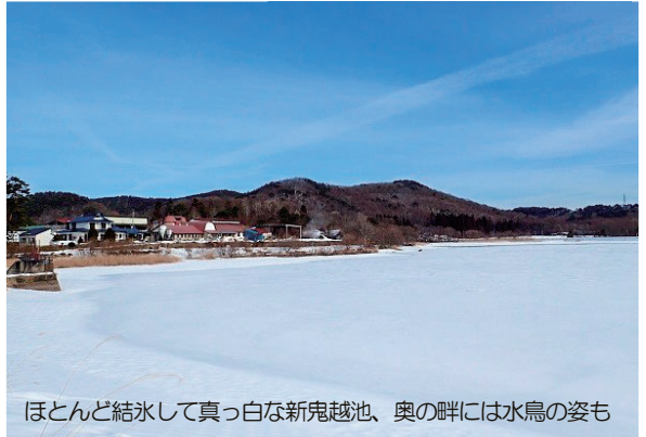
ほとんど結氷して真っ白な新鬼越池、奥の畔には水鳥の姿も

平安時代、坂上田村麻呂の朝廷軍によって蝦夷の大武丸が長者館（姥屋敷南方）を追われた。大武丸は岩手山の鬼ヶ城に隠れたがそこも攻められ、たまたま燧堀山の北側の坂を下って逃げた。坂はのちに鬼越（おにごえ）坂と呼ばれるようになり、山名の語源もここから派生。他に、アイヌ語の「ウヌンコィ」（山狭の険路）や「オニコンコシュ」（滑る道）が元となったという諸説もある。