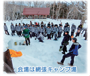
会場は網張キャンプ場